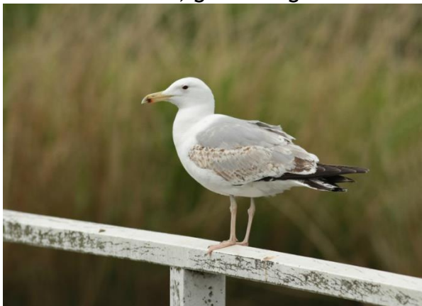
Pontische Meeuw

Naarmate het korter geleden is, zijn er meer en meer gedetailleerde herinneringen. Bijzonder waren de meeuwen op de vuilstort vlakbij Medemblik. Ik heb er wat uren doorgebracht, aanvankelijk om uit te kijken naar kleurringen die Arie Spaans in alle kolonies in Nederland had aangelegd bij pullen. Toen we eenmaal ontdekten, dat je met een telescoop ook de codes op metalen ringen kon ontcijferen, hebben we kunnen vaststellen, dat uit zo ongeveer alle landen van Europa de meeuwen ook bij ons langs kwamen. Wat te denken van een Zilvermeeuw van de Shetland eilanden, die in juni werd gezien en exact een jaar later opnieuw. Of de Geelpootmeeuw uit de Povlakte in Italië. Of een wellicht Pontische meeuw uit oostelijk Duitsland. Die werd de aanleiding om de ringer, Ronald Klein, eens op te zoeken om in zijn werkgebied de vuilstortplaatsen af te kijken. In totaal zijn er op deze wijze meer dan 6000 ringaflezingen gedaan. Opvallende soorten: zeearend, grote burgemeester en zwartkopmeeuw. Mijn notitieboekjes van toen