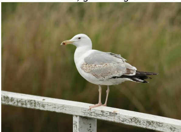
Pontische Meeuw

Naarmate het korter geleden is, zijn er meer en meer gedetailleerde herinneringen. Bijzonder waren de meeuwen op de vuilstort vlakbij Medemblik. Ik heb er wat uren doorgebracht, aanvankelijk om uit te kijken naar kleurringen die Arie Spaans in alle kolonies in Nederland had aangelegd bij pullen. Toen we eenmaal ontdekten, dat je met een telescoop ook de codes op metalen ringen kon ontcijferen, hebben we kunnen vaststellen, dat uit zo ongeveer alle landen van Europa de meeuwen ook bij ons langs kwamen. Wat te denken van een Zilvermeeuw van de Shetland eilanden, die in juni werd gezien en exact een jaar later opnieuw. Of de Geelpootmeeuw uit de Povlakte in Italië. Of een wellicht Pontische meeuw uit oostelijk Duitsland. Die werd de aanleiding om de ringer, Ronald Klein, eens op te zoeken om in zijn werkgebied de vuilstortplaatsen af te kijken. In totaal zijn er op deze wijze meer dan 6000 ringaflezingen gedaan. Opvallende soorten: zeearend, grote burgemeester en zwartkopmeeuw. Mijn notitieboekjes van toen