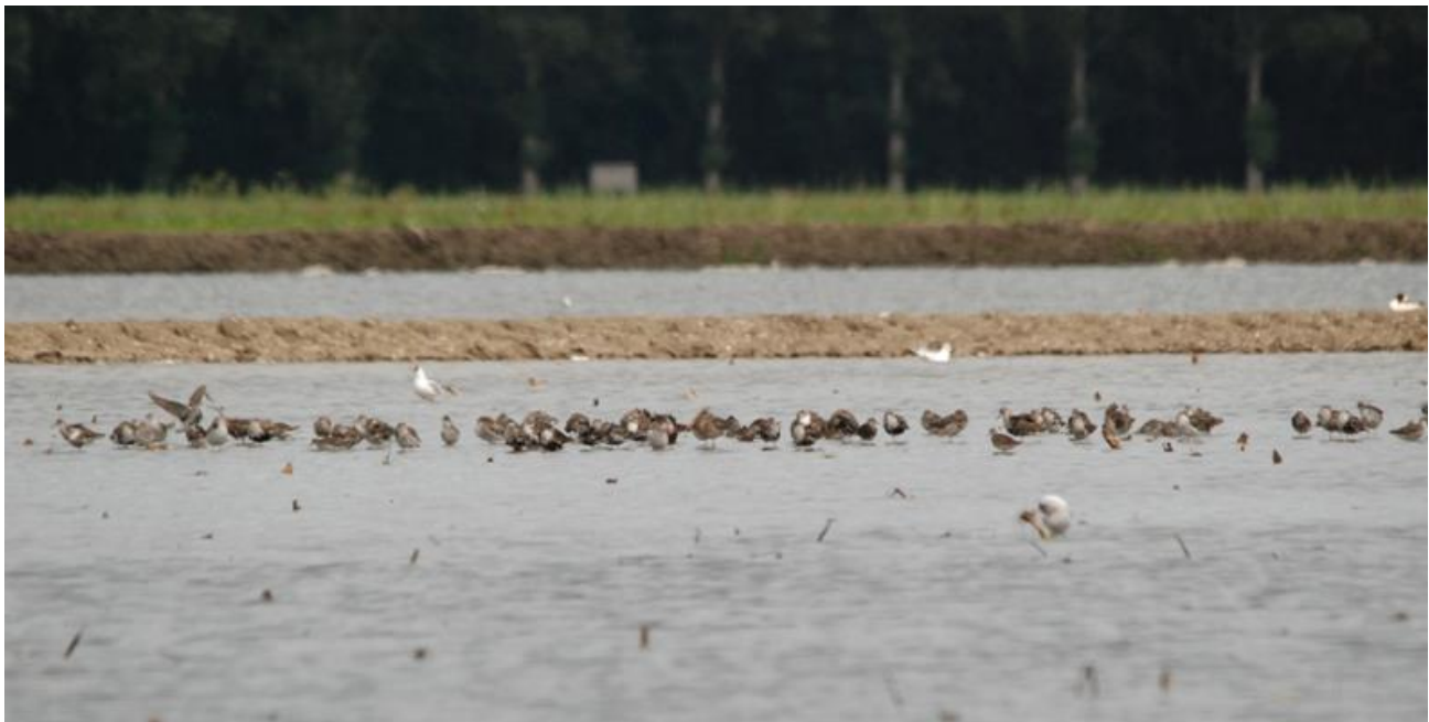
Inundatie in de Wieringermeer trekt veel vogels aan

Balans? De romantiek is er wel vanaf. Je hebt amper nog een keus, anders dan mee te gaan in de jachtige wereld van meer, mooier, groter.