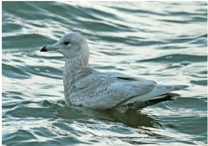
Kleine burgemeester