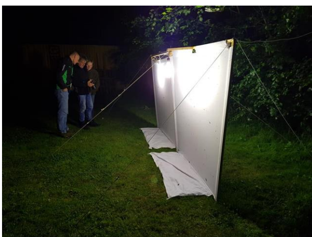
Nacht van de Nachtvlinder