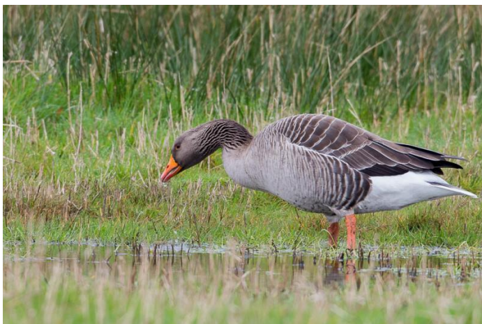
Grauwe Gans

Landelijk zijn ooievaar, een aantal soorten roofvogels, waaronder grauwe kiekendief en verder grauwe klauwier uit een diep dal weer omhoog geklommen. zeearend, kraanvogel, grote en kleine zilverreiger, zwartkopmeeuw en witwangstern zijn nieuwkomers. Een succesverhaal voor onze regio wordt geschreven door lepelaar, kerkuil en appelvink, maar