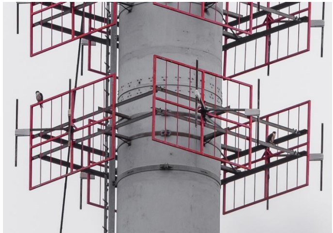
Slechtvalken in de TV-mast

Opnieuw zijn we bij de Voorhaven maar nu met daglicht. We drinken een kop koffie en nemen ons zoveelste broodje. Ondertussen zien we lepelaar, grote mantelmeeuw, oeverloper, twee grote zilverreigers en natuurlijk vliegen er de nodige oeverzwaluwen rondom de succesvolle oeverzwaluwwand. Met de telescoop zien we op een nagemeten afstand van 2,48km bovenin de televisietoren een slechtvalk zitten.