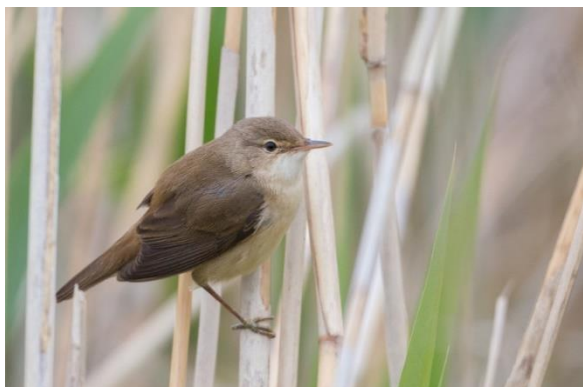
Kleine Karekiet

Zoals voorgaande jaren starten we met de auto en onze eerste stop is bij de Zuiderhaven.